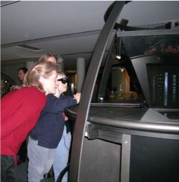
Виртуальная витрина в Бонне.