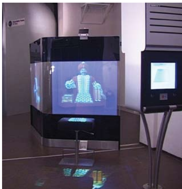
Виртуальный шоу-кейс "Турецкий шахматист", Технический музей в Вене.

➤ Расскажите, как технологии виртуальной реальности используются в архитектурном моделировании и проектировании?