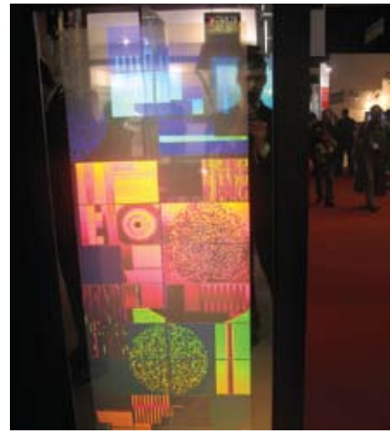
Решения HoloSign могут использоваться в архитектурных инсталляциях – представьте себе, что это фасад здания!