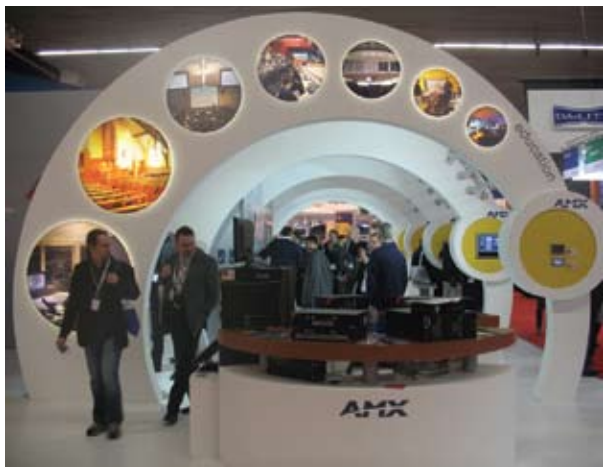
Стильная и запоминающаяся конструкция стенда AMX позволяла удобно организовать взаимодействие с многочисленными посетителями.