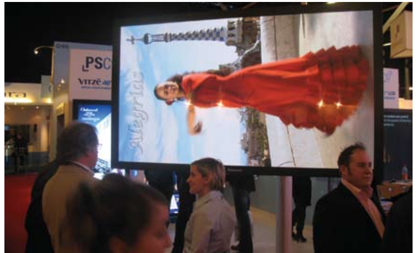
Лифтовый подъемник PSCo позволяет легко управляться с плазменными панелями.