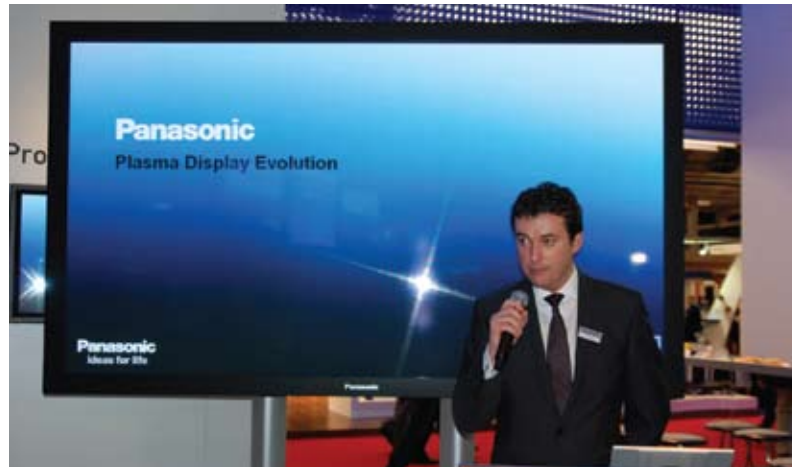
Плазменная панель Panasonic с диагональю 150" произвела на выставке подлинный фурор.

* Подробнее об этом можно узнать в октябрьском выпуске журнала InAVate Russia за 2007 год или на сайте www.inavate.ru .