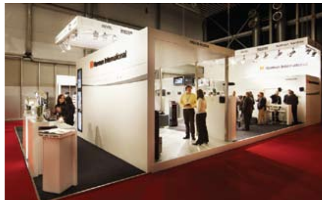
Группа компаний Harman International впервые представила на выставке такие известные бренды, как JBL, AKG и Lexicon.