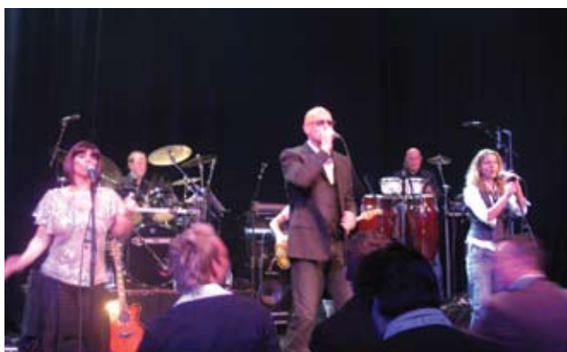
В честь своего 25-летнего юбилея компания Extron устроила небольшую вечеринку для 2000 гостей.