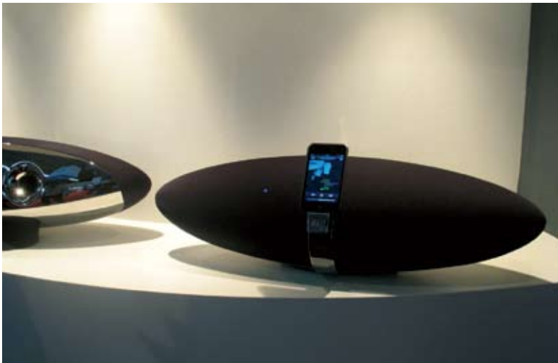
"Аудиояйца" для iPod – акустическая система Zeppelin компании B & W.