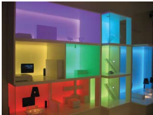
"Умный дом" Philips.