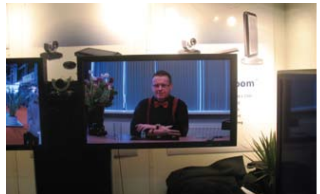
"Поставив на кон" свою визитку, на стенде компании LifeSize можно было проверить свою наблюдательность, сыграв в наперстки по видео-конференц-связи высокой четкости.

и, благодаря четкой нацеленности, привлечь "нужных" посетителей, радужа экспонентов их числом и качеством. В грамотном таргетировании – один из ключевых аспектов