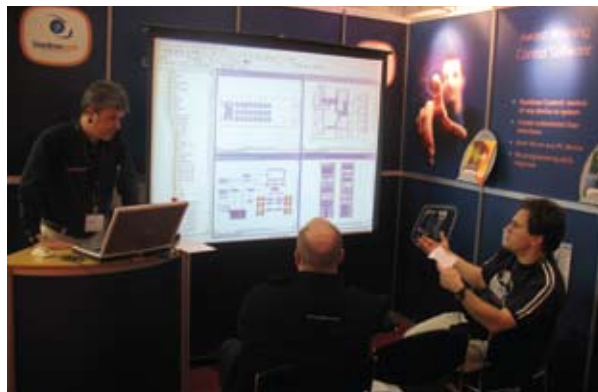
Программные продукты Stardraw уже второй год подряд завоевывают награду EMEA+ InAVation Awards. Вскоре появятся и русские локализованные версии.