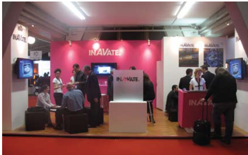
На стенде InAVate всегда было много народа.

Что такое “интегрированные системы” для русского человека? Нечто абстрактное, неосязаемое, непонятное... Но если попробовать перевести эти греческие слова на русский, мы получим такие фразы, как “цельный строй”, “полный порядок”, “единый мир”. И эти фразы очень точно описывают