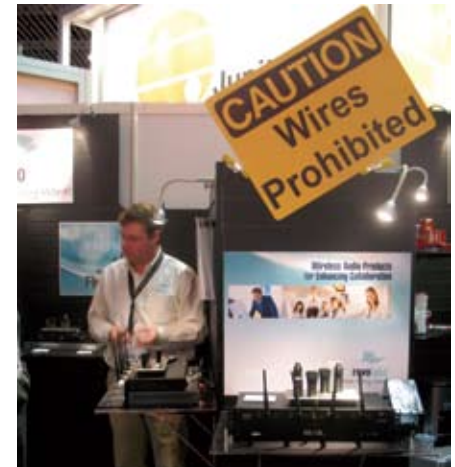
Аудиорешения Revolabs: провода запрещены!

ставкой NSCA System Integration Expo*. Во-вторых, наконец свершится слияние AV и IT, о котором так долго говорят: с 16 по 19 июня в этом же выставочном центре будет проходить одно из главных событий в области информационных технологий и телекоммуникаций – NXCComm (скажу по секрету, что билеты на одну выставку будут годиться и для другой). Кстати,