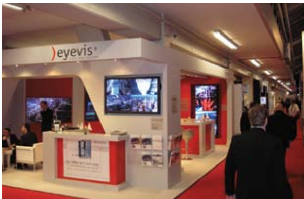
Компания Eyevis представила новые решения для ситуационных центров и диспетчерских.